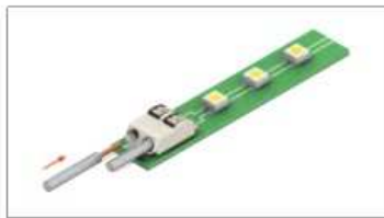
Кабель с однопроводной жилой вставляется без инструмента.

Клеммы считывателя позволяют производить быстрое подключение без использования инструмента. Вы можете использовать кабель с однопроводными или многопроводными жилами общим сечением от AWG24 (0,2мм 2 ) до AWG18 (0,82мм 2 ), например, КСПВ 8x0,5, стандартная витая пара CAT5.