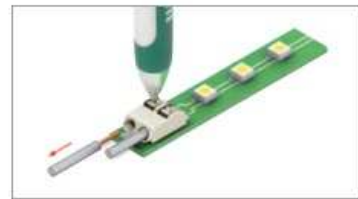
Любой кабель отсоединяется после нажатия на фиксатор клеммы.