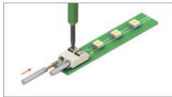
Кабель с многопроводной жилой вставляется после нажатия на фиксатор клеммы.